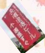
フィギュアミュージアム前にて

大きな事故なく終わることが出来ました。来年度も皆さんの笑顔をたくさん見られるように楽しい旅行を計画したいと思います。