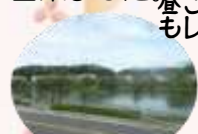
昼ごはんのおばんざい

大きな事故なく終わることが出来ました。来年度も皆さんの笑顔をたくさん見られるように楽しい旅行を計画したいと思います。