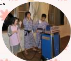
たくさんの料理にお腹いっぱいになりました。

1日目は長浜市内にある黒壁スクエアという観光地に行き、昼食とフィギュア食事場所までみんなでアミュージアムを見てきました。古い町並みが多く残っており町全体がレトロなおしゃれな雰囲気でした。ミュージアムの中はテレビや映画の世界に入ったような錯覚を覚えました。