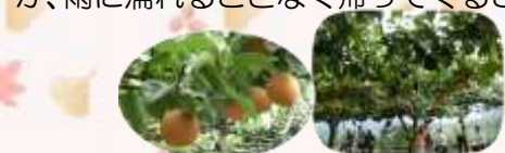
数種の梨を食べました。

近年まれに見る異常気象で天気が心配されましたが、雨に濡れることなく帰ってくる事が出来ました。