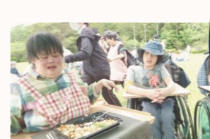
4年ぶりに外でお弁当を食べました。

少し暑いぐらいの好天の中、お弁当やお菓子を食べて、レジャーシートに寝転んだり、園内を散策したり各々自由な時間を過ごし、久しぶりの開催にご利用者の生き生きとした表情を見ることができました。