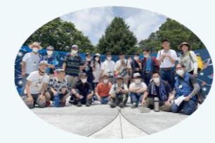
日本へそ公園にて