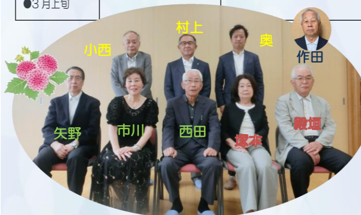
(理事) 理事7名・監事2名の皆様