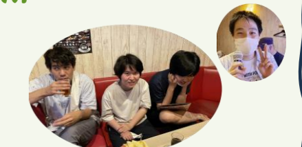
おさるの村のカラオケ

6月には「あまご村」に行く予定でしたが、雨天のため「トマト&オニオン」でランチ、「おさるの村」でカラオケをしました。