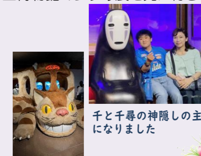
千と千尋の神隠しの主人公になりました

6月23日には通所バスで神戸市中央区にある神戸市立博物館のジブリ展を見に行きました。