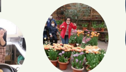
フルーツフラワーパークでのウォーキング