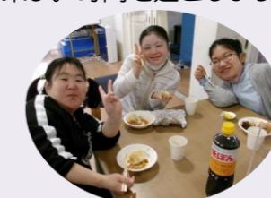
天候が心配でしたが、雨も降らずみんな焼肉を満喫していました