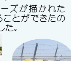
スターウォーズのANA

6月29日には日本へそ公園へ行きました。プラネタリウムで夏の星座を鑑賞したり自家発電の自転車に乗ったりしました。