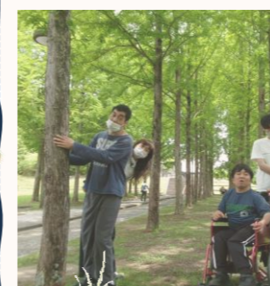
日本へそ公園にて

少し暑いぐらいの好天の中、お弁当やお菓子を食べて、レジャーシートに寝転んだり、園内を散策したり各々自由な時間を過ごし、久しぶりの開催にご利用者の生き生きとした表情を見ることができました。