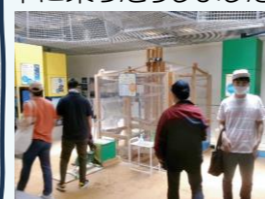
プラネタリウム鑑賞

6月29日には日本へそ公園へ行きました。プラネタリウムで夏の星座を鑑賞したり自家発電の自転車に乗ったりしました。