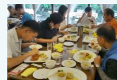
豪華なランチを頂きました