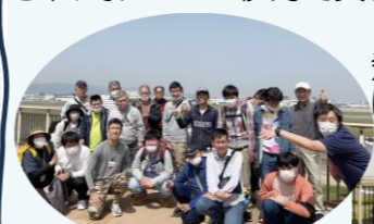
伊丹スカイパークにて

4月は伊丹スカイパークで離発着する飛行機を見ながら、イオンモール伊丹で買ったお弁当を食べました。