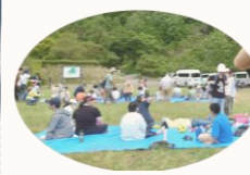
暑いけど事業所から歩いて行きました