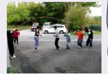
事業所前での大縄跳び

6月23日には通所バスで神戸市中央区にある神戸市立博物館のジブリ展を見に行きました。