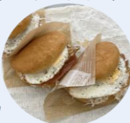
第三弾の月見フォカッチャー

第一弾はアスパラ肉巻きドック、デニッシュグラタンドック。第二弾はメロンパンアイス販売しました☆第三弾となる新商品は「月見フォカッチャー」です。