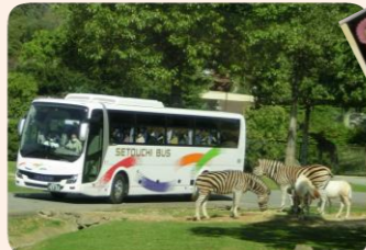
サファリパークでの弁当