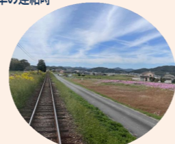
満開のコスモス畑を右に通過