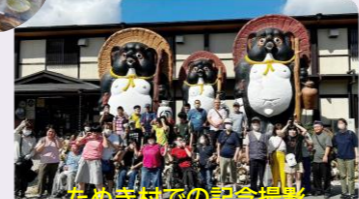
たぬき村での記念撮影

9月になったとはいえ、日中の京都は暑く、熱中症にならないようにソフトクリームなどの冷たいものを食べたりジュースを飲んだりして、それも思い出の一つになったのではないのでしょうか。また来年も行きたいね!!