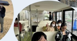
浦富海岸めぐり遊覧船に乗って

透明度の高い海水は緑色に輝き、とても美しい景色でした。参加者22名、皆で共にこの景色を見られた事、雨もまた良い思い出になりました。