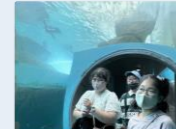
城崎マリンワールド魚の下を歩きました楽しそー!

余部鉄橋では「空の駅」に上ると「うあ!高い!!」と歓声が上がります。電車が通ると「電車が来た!」と歓声が上がります。気持ちが素直に言葉に表れるのが志手原事業所の良さだなぁと改めて実感しました。