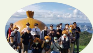
うずの丘「玉葱」の前での記念撮影にて