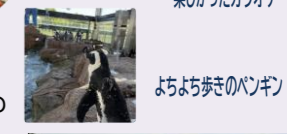
よちよち歩きのパンギン

9月になったとはいえ、日中の京都は暑く、熱中症にならないようにソフトクリームなどの冷たいものを食べたりジュースを飲んだりして、それも思い出の一つになったのではないのでしょうか。また来年も行きたいね!!