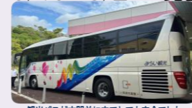
観光バスが玄関前に来てとても安全でした

ウルトラマンや仮面ライダーの大きな人形をバックに集合写真を撮り、時代劇に出てくる街並みを散策しました。