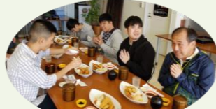
ミックスフライ定食「いただきます!!」

一日目、最初の目的地は、うずしおクルーズが出航する福良港へ行き、乗船して渡ってきた鳴門大橋の下で、海岸沿い風景やメインの渦潮を観て貴重な時間を堪能しました。また、降船後はレストランなないろにて、ボリューム感があるミックスフライ定食をいただきました。