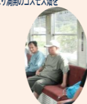
始めて列車に乗る方もいました

普段できない経験ができて、利用者の皆さんも大喜びで、終始笑顔で満喫することができました。