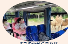
バスの中からラクダ