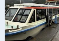
これに乗りました

天気が悪いので朝から浦富遊覧クルーズの出航を心配しましたが、波が穏やかだったため無事に船からジオパークが間近に見られました。