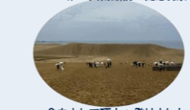
傘をさして頂上へ登りました