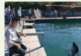
「じゃのひれ」のドルフィンファーム

続いての訪問は「じゃのひれ」で、ドルフィンファームでは2m前後の至近距離でイルカを見た後、希望者には馬の餌やり体験をしていただきました。