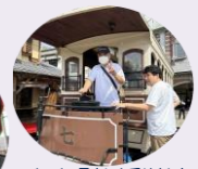
チンドン電車にも乗りました