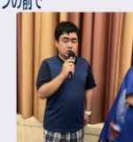
楽しかったカラオケ