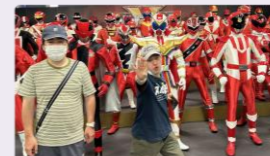
ウルトラマン1号から0号まで

ホテルに着くと、さっそく温泉に入りました。宴会ではテーブル一杯の食事が準備され、楽しみにしていたカラオケで大盛り上がりでした。