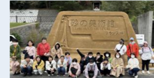
砂の美術館前で記念撮影

2日目はあいにくの雨...。まず「砂の美術館」へ行きました。その後、鳥取砂丘に行き雨が本格的に降り始めましたが、傘を差しながら砂丘を歩きました。