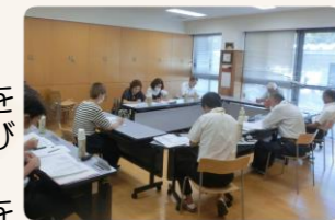
各プロジェクトリーダーによる理事会への報告

他の5つのプロジェクトについては、年度末に向けて一定の方向性が出せるように協議を進めているところです。