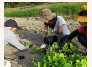
農園を借りて大根の種まきと白菜の苗の植え付けを行いました

報告者はプレゼンテーションのスキルも向上し、今では分かりやすくまとめ説明が出来るようになり、制度やサービスの種類、報酬について学ぶと共に、三田市内の地域のニーズを知るなど大きなスキルアップに繋がっています。結果については、令和7年度4月号のわくわく通信で報告したいと思いますので、是非ご期待ください。