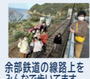
余部鉄道の線路上をみんなで歩いてます

1日目のマリンワールドでは、釣りをするグループ、展示を見るグループ、お土産を探すグループに分かれて様々な体験をしました。