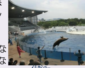
イルカショー水しぶきがすごかったー