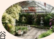
温室の中 蘭・食虫植物