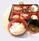
昼食のサムライ弁当