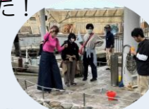
元気なアジがとれました