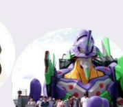
エヴァンゲリオンの前で