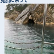
遊覧船からの景色

帰りのバス内では、さっそく来年の旅行の話が出ていました(汗)来年も楽しい旅行が実施できるよう1年かけて構想を練ります!!志手原☆最高!!