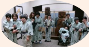
全員ゆかた姿で夕食を食べました

1班 9/12~9/13と2班 10/24~10/25 で分かれて一泊研修旅行に加西・姫路方面に行ってきました。1班は暑過ぎるぐらいでしたが天気にも恵まれました。2班は気候もよく快適な楽しい旅行となりました。1日目は加西のフラワーセンターに行き、温室で蘭や食虫植物を見たり2班は菊花展を歩きながら鑑賞しました。