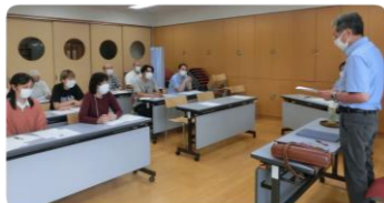
福本社会科学博士による事故防止の管理職研修

職員の不注意により、作業資材納品時及び公園清掃時に利用者の方を見失う事故が続きました。本来すべきこと(乗車確認)を怠ったこと、利用者の障害特性に応じた対応が行われなかったこと等が主な原因でした。