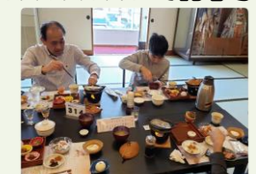
朝ごはんをいっぱい食べて今日も観光(〜)

二日目、朝食は7:30で、時間に余裕があることから、うずの丘に立ち寄り淡路ワールドパーク ONOKORO で記念写真を撮りました。