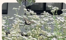
夕方 アサギマダラが止まっていた

大原事業所に植えているフジバカマに今年もアサギマダラが飛んできました。年々フジバカマが増え、周りの草の発生を止めてくれ蝶々も飛んできてみんなを楽しませてくれます。