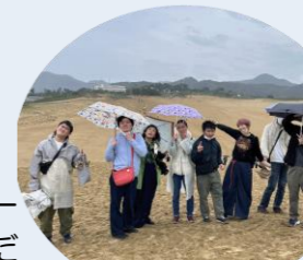
雨降りの方が歩きやすかったかも?

天気が悪いので朝から浦富遊覧クルーズの出航を心配しましたが、波が穏やかだったため無事に船からジオパークが間近に見られました。