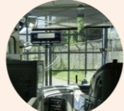
各エリアがゲートで仕切られバスが通過したら次のゲートが開きます