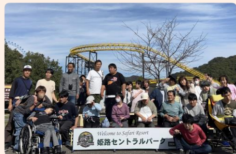
2班 集合写真(姫路セントラルパークにて)

2日目は姫路セントラルパークのサファリをバスの中から見学し、その後北条鉄道の貸し切り列車に乗って北条駅と栗生駅を往復。利用者は楽しそうでした。