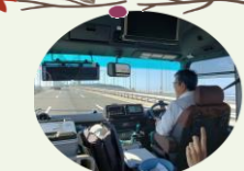
明石海峡大橋を通過

10/10~10/11 暑さの落ち着いた10月上旬に淡路島へ行きました。天候に恵まれた中、出発から1時間ほど経て、明石海峡大橋を渡る時は、普段とは違う異世界への関門を通過するように心が弾みました。